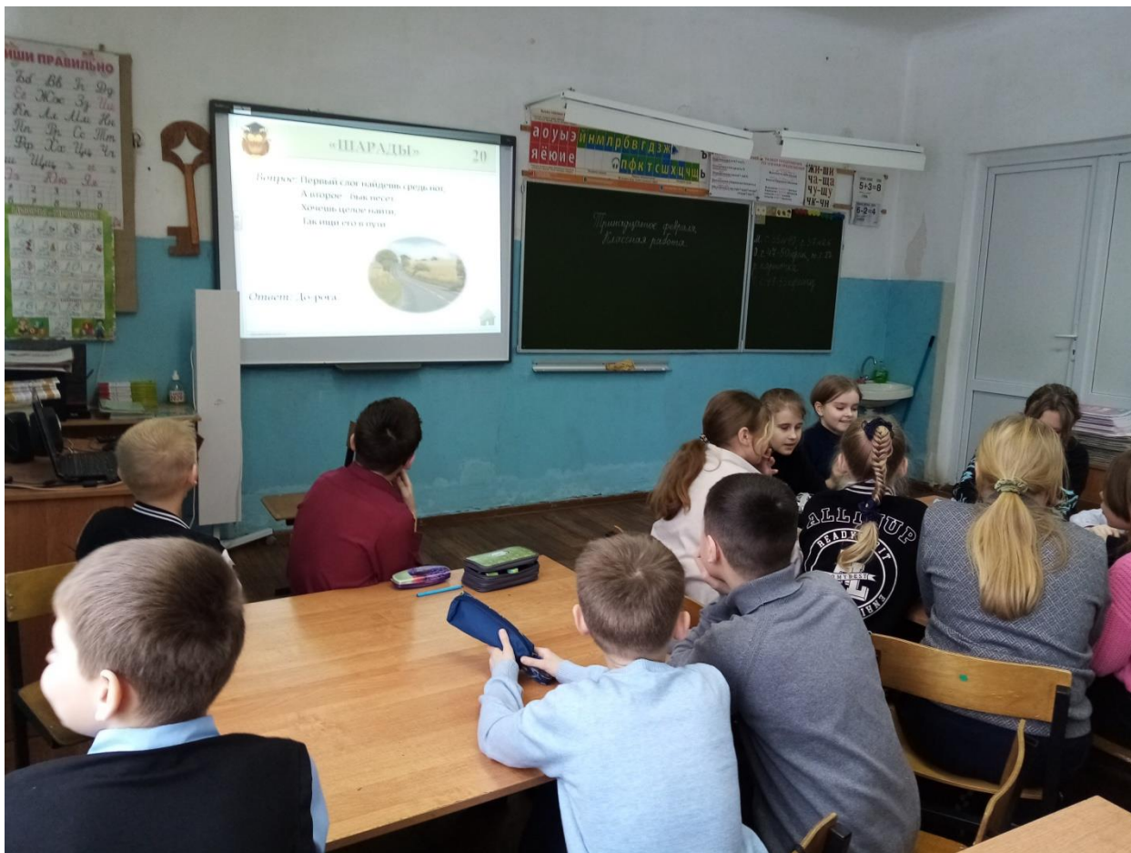
В 4Б классе проведена викторина «Словесный калейдоскоп».