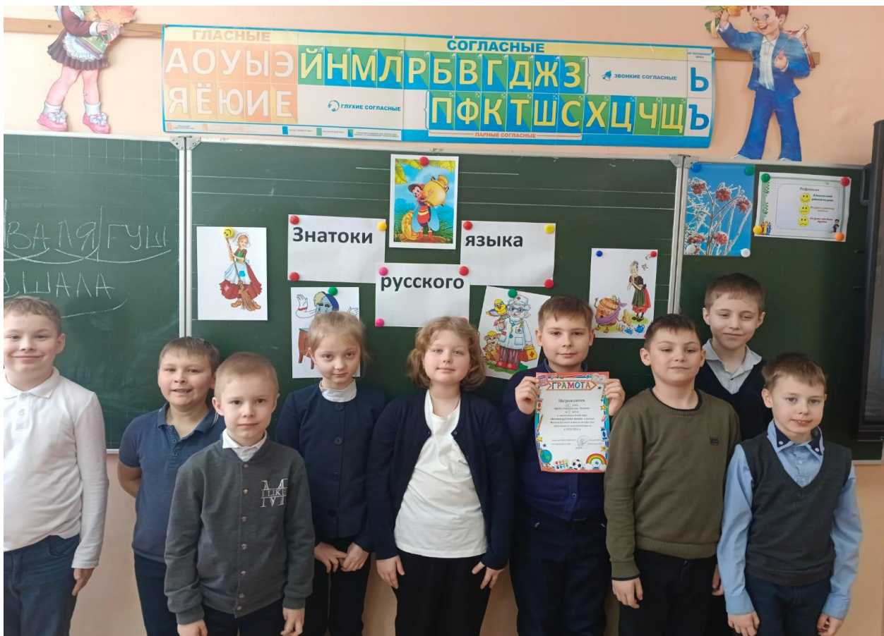
2 место занял 2Б класс.