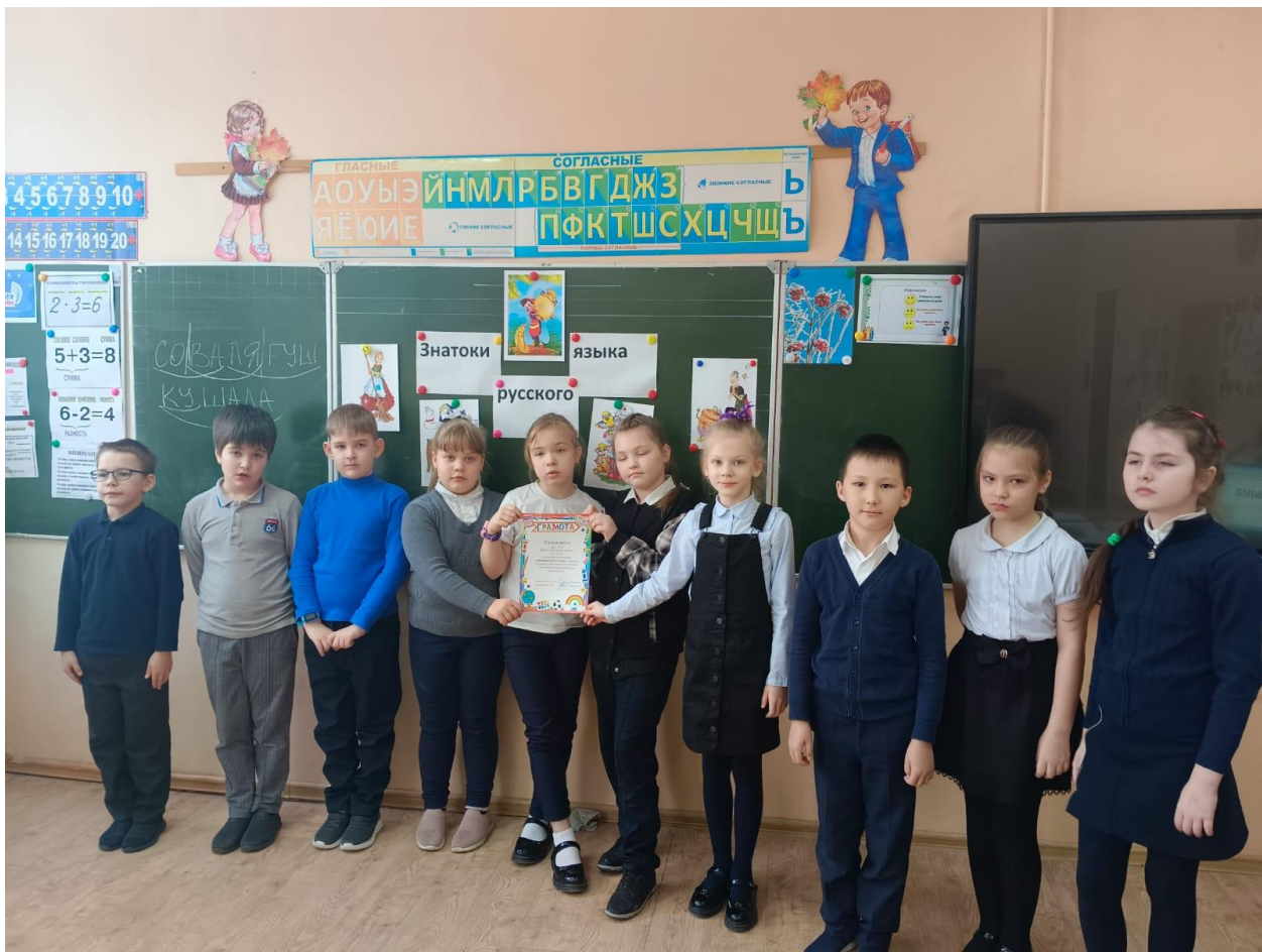
1 место занял 2А класс.